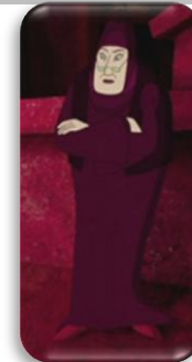
La belle au Bois dormant