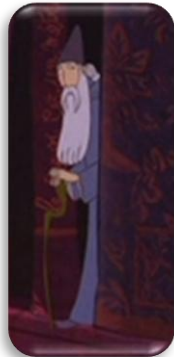
La légende du roi Arthur